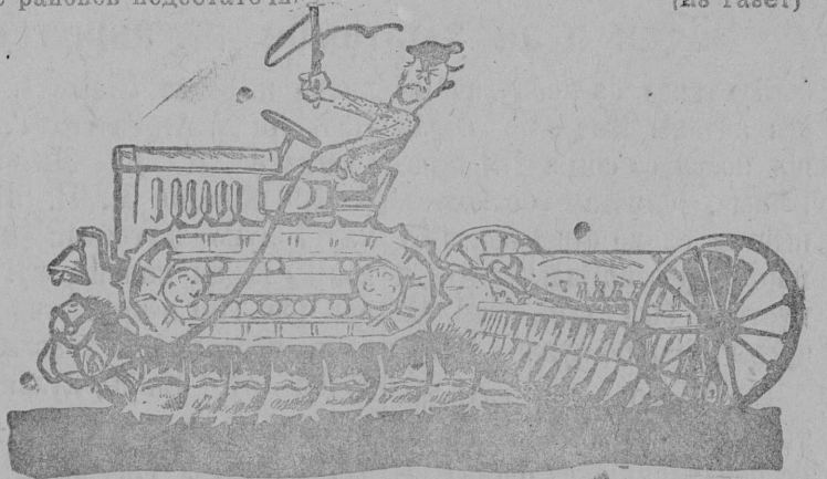
На гусеничном ходу

По сводкам коллегии НКЗ СССР темпы сева в целом ряде районов недостаточны (из газет)