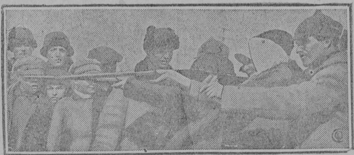
Кантемировский осовиахим устроил тир на районной советской Ярмарке. На снимке: Колхозницы учатся стрелять.