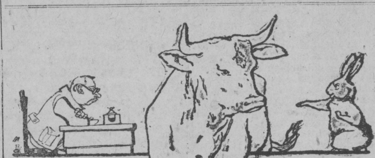
КРОЛИК:-Подняться надо, тогда меня заметишь!

Merjatik poraas uməla doziraçtisə partijnəj jaçejkaez, da s-ovettez sişən i etəəm suşkəməş fogm'is. S sov. da partijnəj jaçejkaezlə kolə əddənzьk vizətləny medvь mətpьrşə ezə fogmə, a lətə fogməməş əni-zə kolə vəşçətis. zava