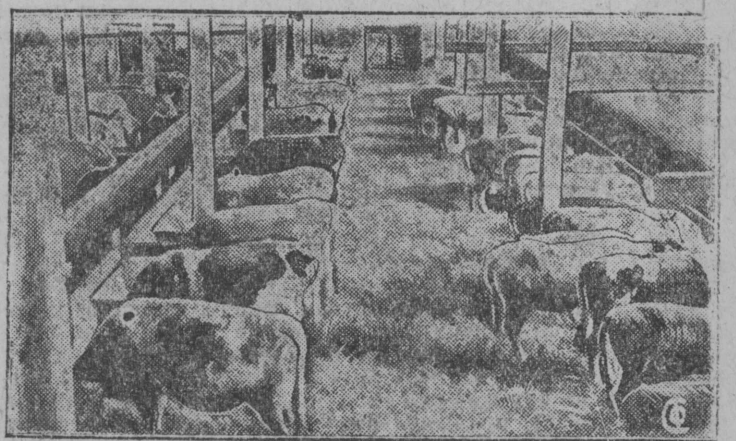
Скотный двор в Сергиевском племхозе ЦЧО