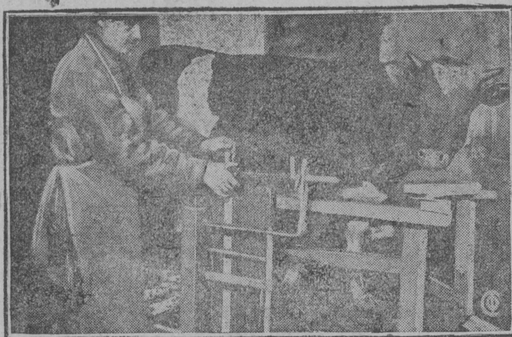
На снимке: Взвешивание коровы для проверки ее живого веса.