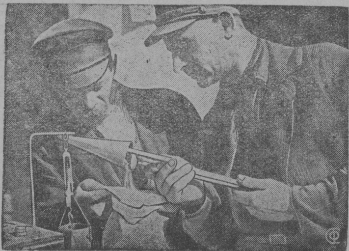
На снимке: проба зерна на приемном пункте загот зерна для определения сортиности и влажности зерна.