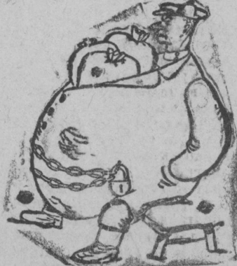
Когда Колхозника приобретает сходство с кулаком

Беспощадноја судитны саботажниккезэ, намзаптан ујч да көзис кјетөм падмөтисөзэ, лөбтыны быдөс деревнаис актив намзаптан план вершитөм вылө, көзис заптөм вылө. Обязательство государство озынијан округдолжон тыртны быдөсөн етна-жэ луннезө.