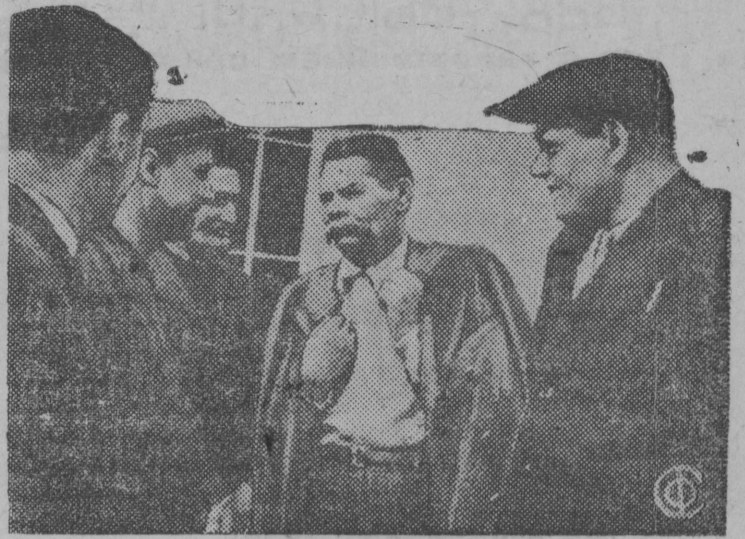
Знатные люди Советской страны у А. М. Горького