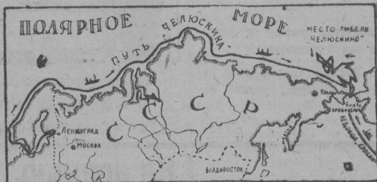
Путь „Челюскина“ вокруг северных берегов Азиатского материка

„Челюскин“ предстояло проложить путь, пройденный „Сибиряковым“ в 1932 г. и пройти тип грузового судна, годного для плавания в полярных морях.