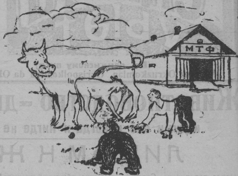
КОРОВА ТЕЛЕНКУ: — Не давай лодырям присасываться, не зачем их прикармливать.

12. Настоящее постановление опубликовать в печати.