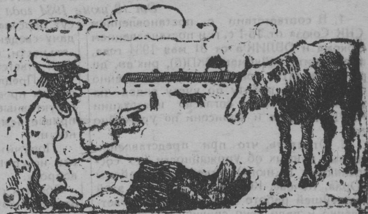
ЛОШАДЬ: Товарищ конюх, помыться-бы надо... КОНЮХ: А к чему тебе мыться? Все равно ведь загрязнишься. Я вот сам уже более полгода в бане не бывал и чувствую себя прекрасно.