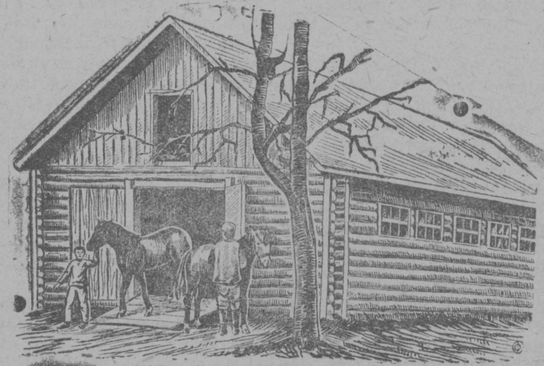
Колхозному коню—теплую, удобную зимовку