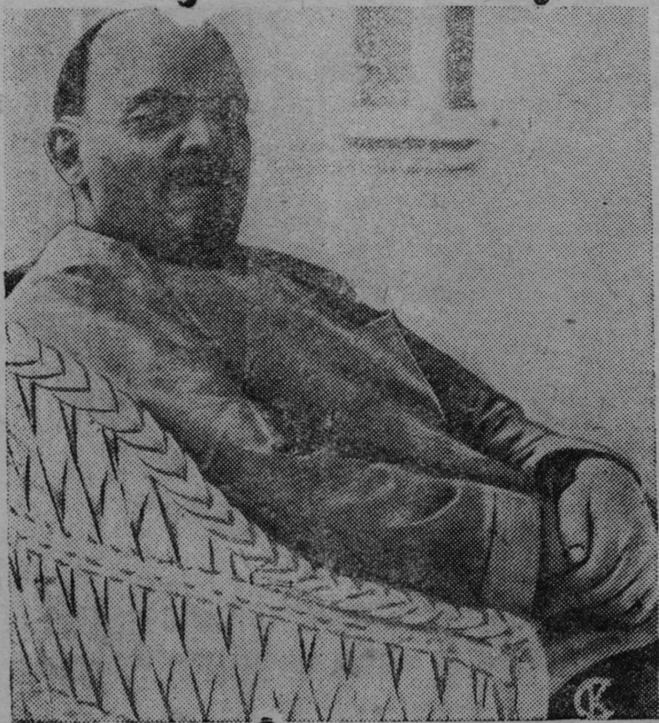
В. И. Ленин в Горках (1922 год).

революции. Он был по-истине гением революционных взрывов и величайшим мастером революционного руководства. Никогда он не чувствовал себя так свободно и радостно, как в эпоху революционных потрясений. Этим я вовсе не хочу сказать, что Ленин одинаково одобрял всякое революционное потрясение или что он всегда и при всяких условиях стоял за революционные взрывы. Нисколько. Этим я хочу лишь сказать, что никогда гениальная прозорливость Ленина не проявлялась так полно и отчетливо, как во время революционных взрывов. В дни революционных поворотов он буквально расцветал, становился ясновидцем, предугадывал движение классов и вероятные зигзаги революции, видя их, как на ладони. Недаром говорится в наших партийных кругах, что „Ильич умеет плавать в волнах революции, как рыба в воде“.