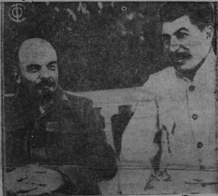
В. И. Ленин в Горках на отдыхе после болезни (Август—1922 год).

Мы, коммунисты,—люди особого склада. Мы скроены из особого материала. Мы — те, которые составляют армию великого пролетарского страдальца, армию товарища Ленина. Нет ничего выше, как честь принадлежать к этой армии. Нет ничего выше, как звание члена партии, основателями которой водителем которой является товарищ Ленин. Не всякому дано выдержать невзгоды и бури, связанные с членством в такой партии. Сыны рабочего класса, сыны борьбы, сыны неимоверных лишений и героических усилий — вот кто прежде всего должен быть членом такой партии. Вот почему партия ленинцев, партия коммунистов, называется вместе с тем партией рабочего класса.