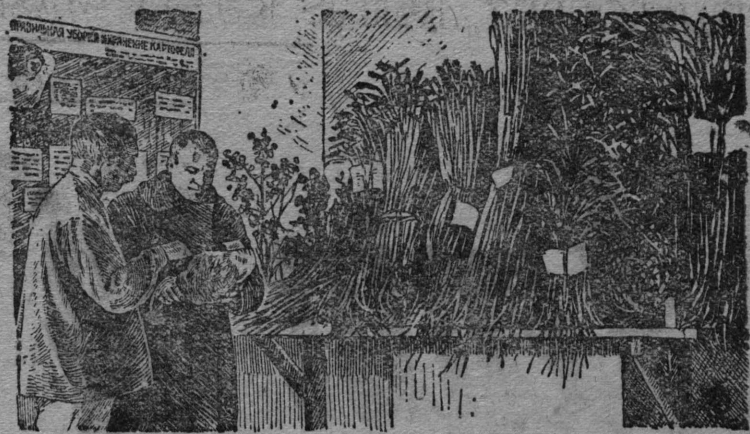
Lōn vīstavka vīlān