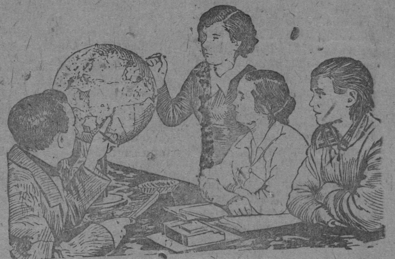
Geografia urok vlvn