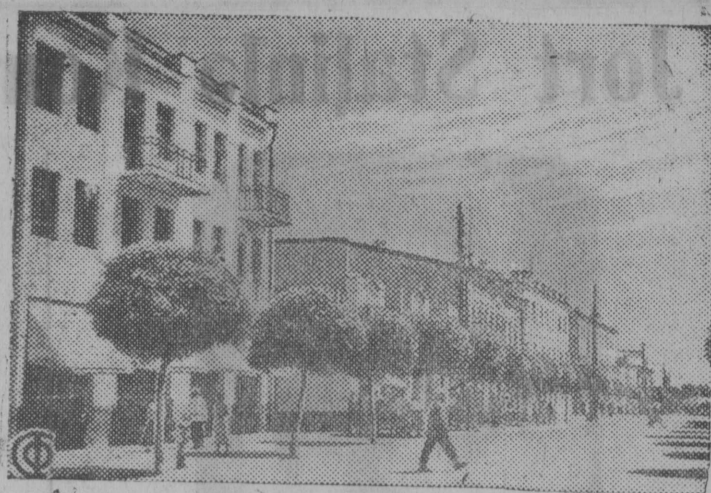
Ordenonosnəj Kavardino—Balkar ijaš Stolica Načik Kовардинskəj ulica.