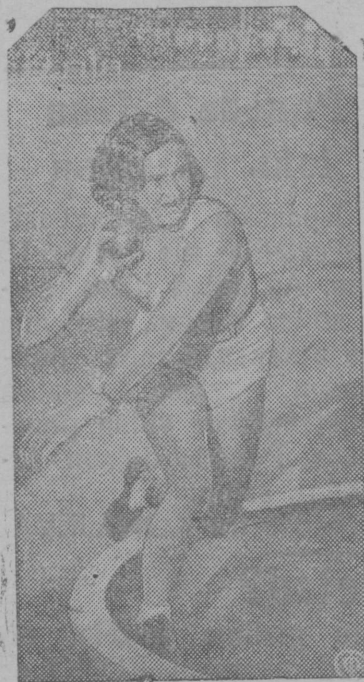
Snitok vlyšn: Rekordsmenka SSSR Galina Turova (Leningrad). Šupkə jadro Ikramov pima Stadion vlyšn.