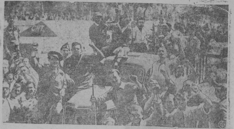
Šnimok vьln: narodnəj mišicijajis katalonskəj časšez, front krapitam ponda loktisə Madridə i šoranьs vajisə značitəlnəj kolijestvo boje-pripassəz.

АДРЕС РЕДАКЦИИ: п. Кудымкар Свердловской области.