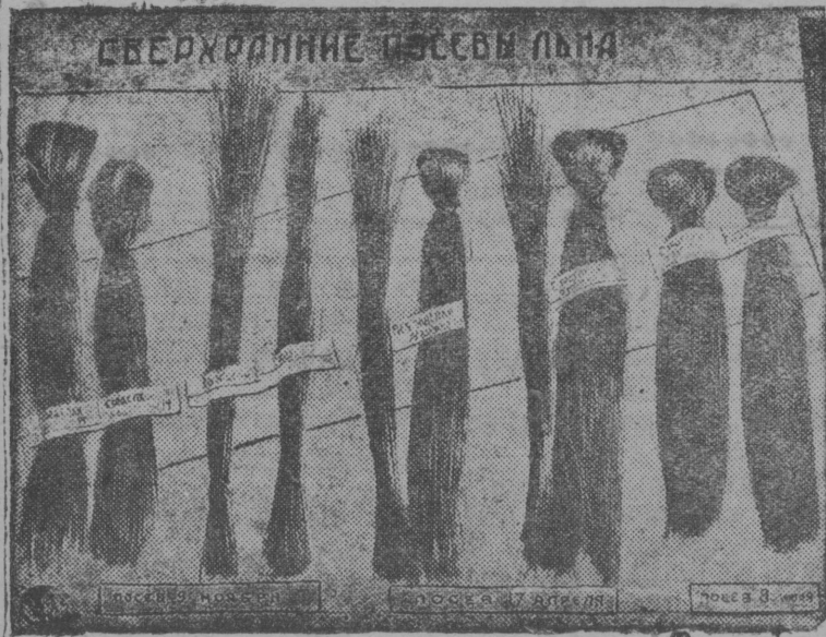
Őelško-xozajstvennėj vьsavka vylėn

Me polučiti „počotnėj gramota“ i 45 rub premija. Eta mijanėš ovjazėvajtė uzavnb esė burzėka, staxanovskaj pėššėnb, med ovėspečitnb podėš šojanėn da kartaėn.