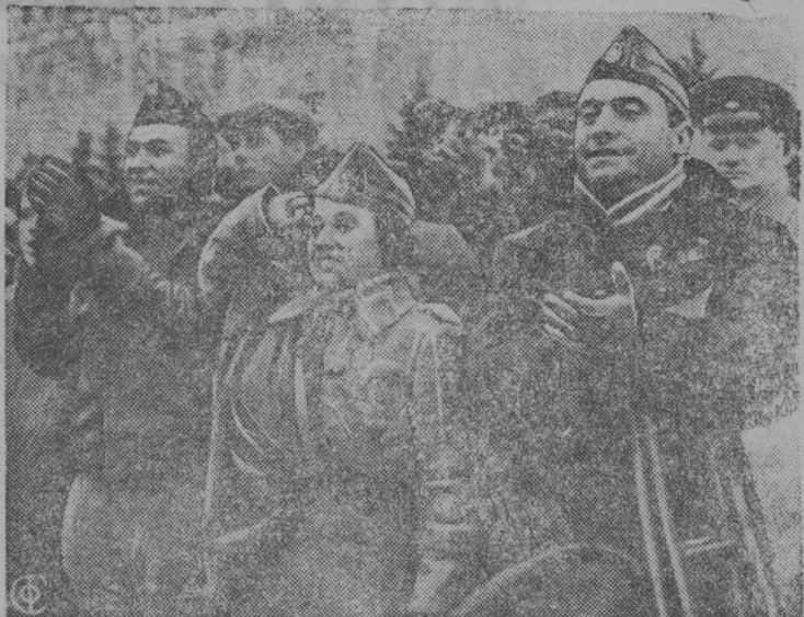
Šnimok vьbn: Ispanskäj respublikanskäj armijälän voješcez—geroičes-käj ispanskäj narodlän delegattez Krasnäjä plošsad vьbn Oktäbrskö godovsina lunnezä.

nekär oz kov šetbn 8—10 mäšša unazьk. Mijan mu-käd fermaezьn mäš vьštisšä šetän 15—20 mäšän, etašañ kolhozlä loä toko ätik ivь-tök. Mäs vьštisšez una mä-ssezäs özä vermä vьeämika vьštьbn, a etašañ mäš čintä udöj. Siz-zä oz kov mäš vьštisšezäs často vezьbn, etaiš tozo vurbš avu. Täv kezä poda šojanän me zar-tiši tьrmämän. Tavo menam fermašn jävšalisä-ñi 8 mäš. Kukañdez vьdäs vasäkäš. Mässez i kukañdez vьdäs ovesspecitamäš täv kezä so-nьt standartnäjä kartäezän.