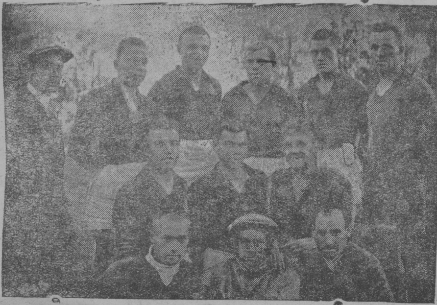
Šnimok vylēn: Kudymkarskāj futbolistezlān komanda

Narodnej obrazovāno. Uzališ otir trudovāj učasitjeēn samooblozenno sredstvaēz vylē stroitn 10 ņevdsā saret skola da 14 pačālnej skola. ņevdsā saret skolaēzēn velātissez ponda stroitn kēk oveszētija; remontrujtn da vbdēn stroitēnē 33 skola. Kolhoznej sredstvaēz vylē stroitn 100 standartnej ņeļad