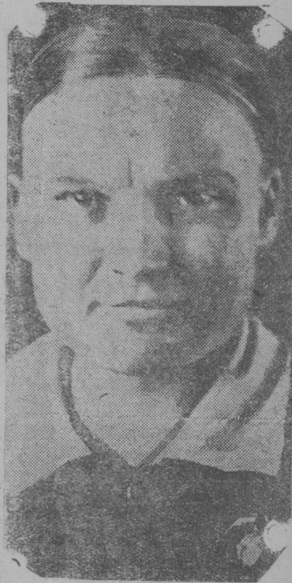
Petuxova Je. M. sovettez çrezvčajnej 8 Vsesojuznej Sjezd vliš delegat.