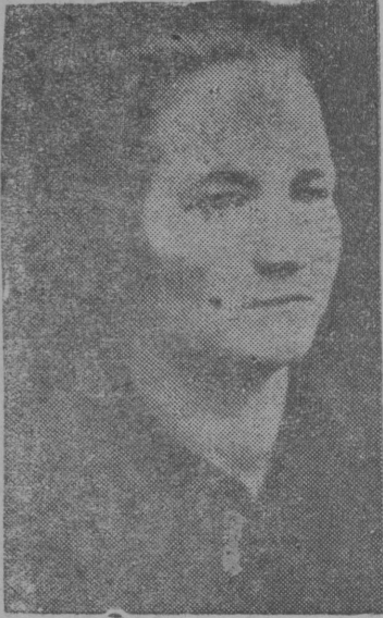
Kourova G. R. Polvinskāj Kolxozis mās čilketis. Tavo čilketis etik mēšān 3000 litr.