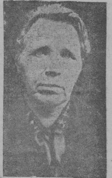
Bajandina Anastasija Alek- seevna Kubenovskāj sko- lais Botalovskāj šġssovġtis Jušġvinskāj rajoniš stārejsāj velġtis