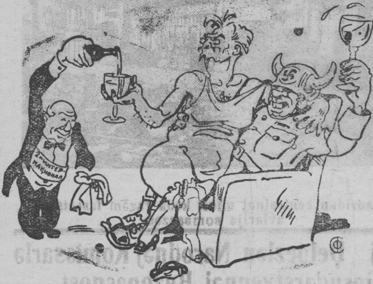
Fasistlā čas. A mēņevikkezēlā minutka Dosugās veš oz es sīlān nekār. Vīdēs-ed tēdis mir, sto etā proštututka Kutavlis sīmda nāfās ki cukār.