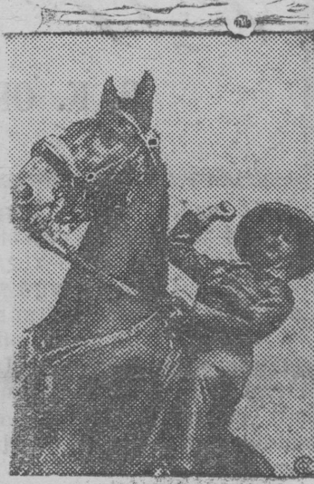
Ispanskəј pravitelstvennəј vojskaezlən vojcekavalerist.

Əni me ləšətca staxanovskəј dvuxdekadnik kezə. Uzavnlənlə i tьrtnlə plan i lunša zadənlə ez mijə vašnitəg pondamə. Plan tь-