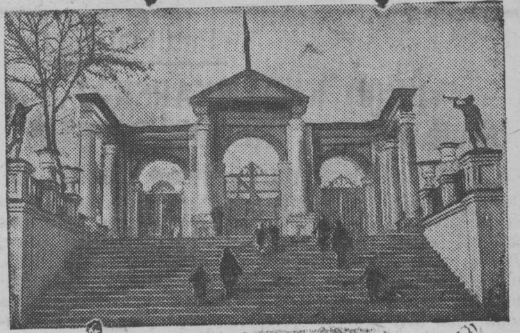
Taskent Pionerrez da oktavrjata dvoreca pyranin

АДРЕС РЕДАКЦИИ: п. Кудымкар Свердловской области