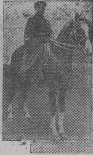
Maj 1 lunə Krasnəj plossad vьln Moskvaьn.

АДРЕС РЕДАКЦИИ: п. Кудымкар Свердловской области