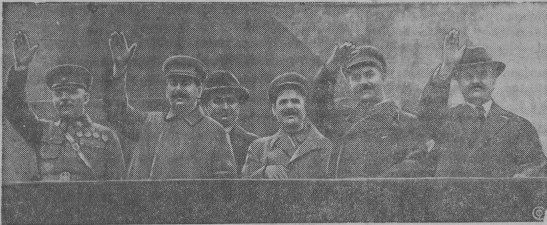
Moskvaьn maj 1-əj lun praznujtəm.

SNIMOK VBLьN: partija da pravitejstvovlən rukovoditellez (Suлgalanən veskьtlanə): jorttez Vorosilov, Stalin, Dimitrov, Andrejev, Kaganoviс, Molotov mavzolej tribuna vьln privetstvujtənь demonstranttezəs.