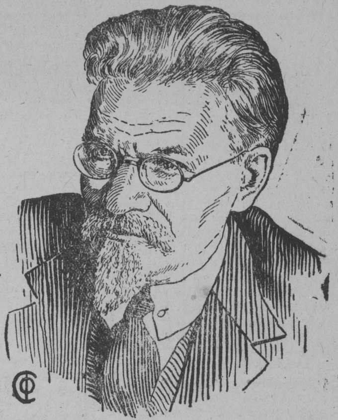
M. I. Kalinין—SSSR CIK-lən predsedatəl— Mezdunarodnəj geologičeskəj kongress XVII Ŗeš Ŗialən počotnəj prezident.

Šu urozaj zimĻaləməz kolč- cis kьk-kuim lun. Kolə re- sьtelnəja kutčьnь kormovəj baza krepitəm verdə, ispol- zujtьnь etnə lunnezəs sь pon- də, med vьdsən končitnь tu- run zimĻaləm, vьdsən tьrtnь Ŗilosovanno da vetočnəj korm zartəm.