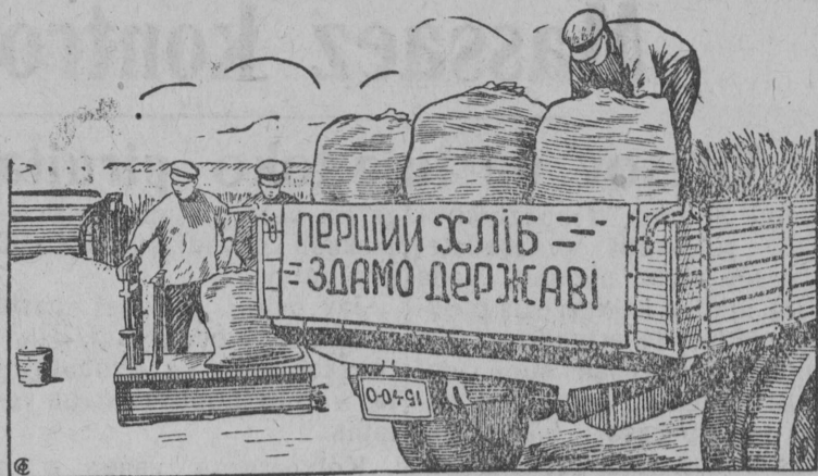
Červonnəj Čongar nima kolhoz (Geçiçeskij rajon, Dnepropetrovskəj ovləšt) pervəj rajonbn šetis nāq gosudarstvələ.

ez lok sōvraçno vblə, i ez šet nekəəm otšət. Kolə pomnitn, sto oso- avixim centralnej sovetbn pukališ otirlən vraggez Əjdeman da sblən oxvostje. Perevbornəj kampanija kos- ta kolə proveritənb osoavi- aximlīs vvd çlenə i kolə otən paškətn iz — likvidirujtn vreditelstvo pošledstvijaez. Vbln kritikaən da samokri- tikaən pozas burmətn obo- ronnej iz mijaŋ okrugbn, kolə vestēnb vokə nesposov- nəj uzališezəs, kəz Jarkov da Totmjanin kodəmmezəs i vərjēnb dostojnəj mortte- zəs, kədna vbl ləšətisə iz osoaviaxim organizacijəb. Isakov