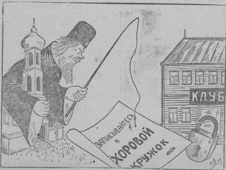
КѲr oz uzav klub.

KolŲ neustannŲja i vŲd lun čulətnŲ anti-religioznŲj uz, razjašnajtŲn massalə viŲ izviratelnŲj zakon i VerxovnŲj SovetŲ vŲrjəmmezŲn vozglavitŲn massaezliš aktivnoš.