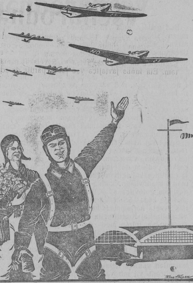
Med olas Sovetskəj aviacija!