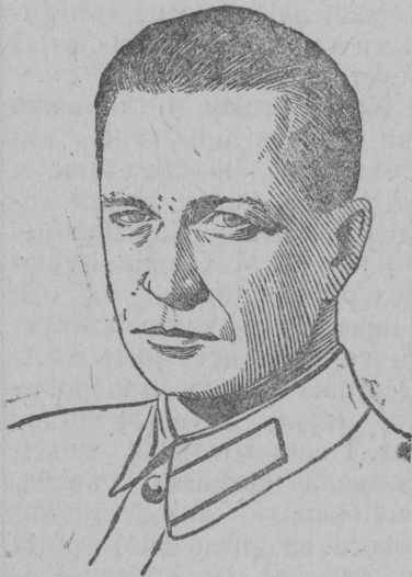
Sovetskəj Sojuzlən geroj M. M. Gromov.

Sovetskəj aviacijalən lun dolzen lonş groznəj demon-stracijaın zvirşaləm fa-sizmlə pañyt da kontrrevo-lucionnəj vojna pañyt.