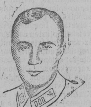
Sovetskəj Sojuzlən gerojjez: Çkalov, Bajdukov da Belakov.