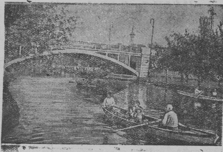
Днепропетровск. Культура да отды паркьн

Krasnojarskьn pomaləm ləşətmə jort Gracianskəjlən kьk motora „N-207“ samo-lot polərnəj polot kezə, kəda levzə Dikson ostrov vьlə, medvь ətlənb jort Golovin-lən „N-206“ samolotkət, kə-da əni pomalə Kazənb do-bavočnəj radiostancija suv-tətm, siz-zə primitnь učas-tije kossəmbn. TASS