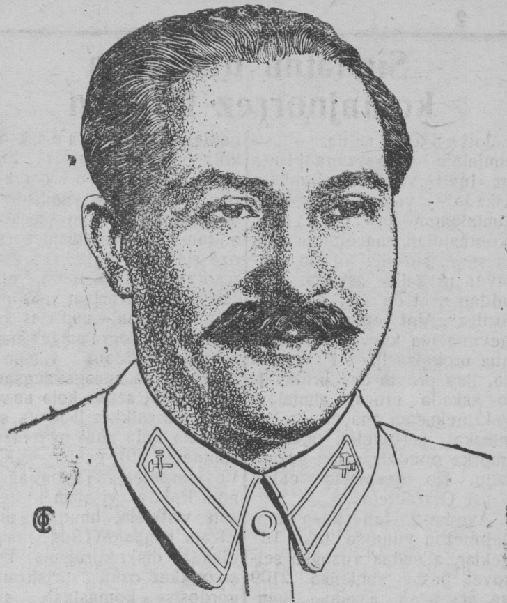
Jort Kaganoviç L. M. — Tazoləj promьşlənnoşlən Narodnəj Komissar