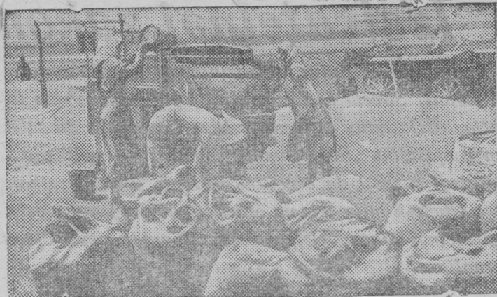
Vorosilov nima kolhozьn (Spartakovskəj rajon, Odesskəj obl) № 2 brigadaьn tələtənь šu vь vьlən.