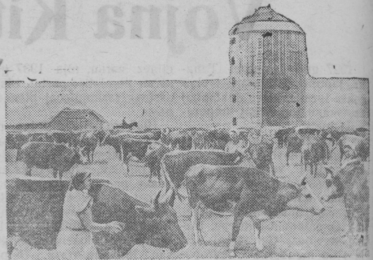
Volodarskaj nima kolxoz (Əlista uv'tn, Kalm'ckaj ASSP) stado'n 34 t'šecə merinosovaj vała da unaz'k 3 t'šecə g'riš poda.