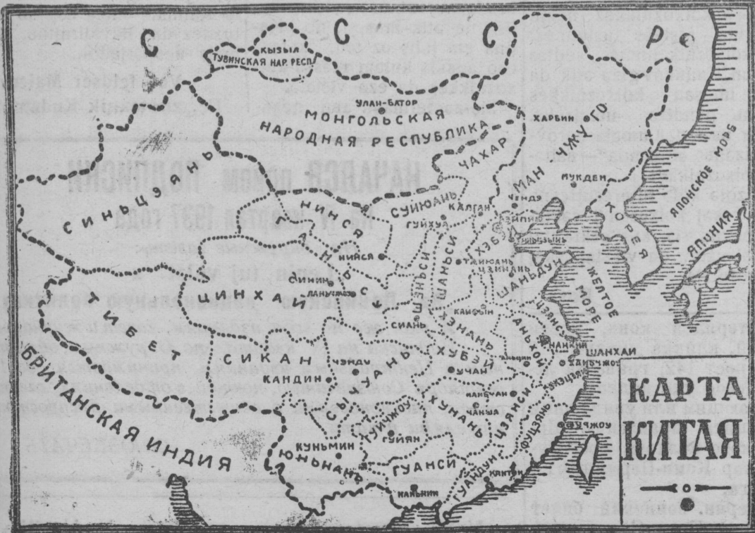
Северной Китайн советияез kezə.

Gainskaja lesxoz n da les-promxoz n vreditellez da na-rodlan vraggez abu e s a v b - d a s r a z o b l a c i t a m a š. O š t a a m - m e z p o p u s t i t e l s t v o a n p o l z u j t - c a n n i j a i p r o d o l z a j t a n k e r - n b a s s i n s n a t a š d e l o e z. Novošolov