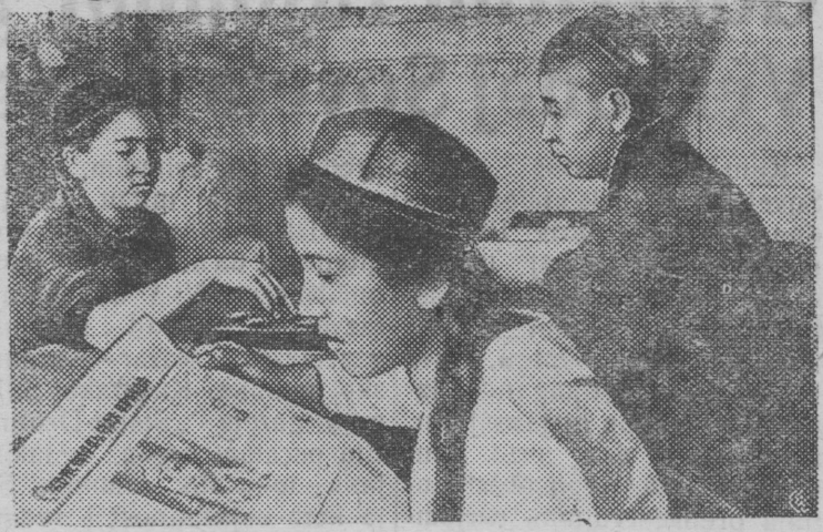
ŞNIMOK VЬLƏN: obov nəj da kozevennəj tєx-ŋikumis praktikantez fabrikaš stampovočnəj cex-lən sotčisan komnata n.