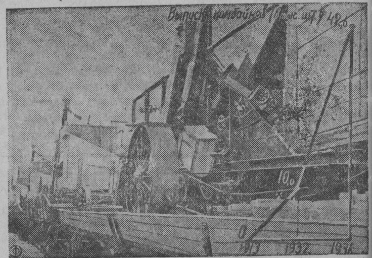
В одном только 1936 г. заводы сельскохозяйственного машиностроения дали стране 42 600 комбайнов Эшелоны с готовыми комбайнами для совхозов и МТС на Саратовском заводе комбайнов и диаграмма выпуска комбайнов.