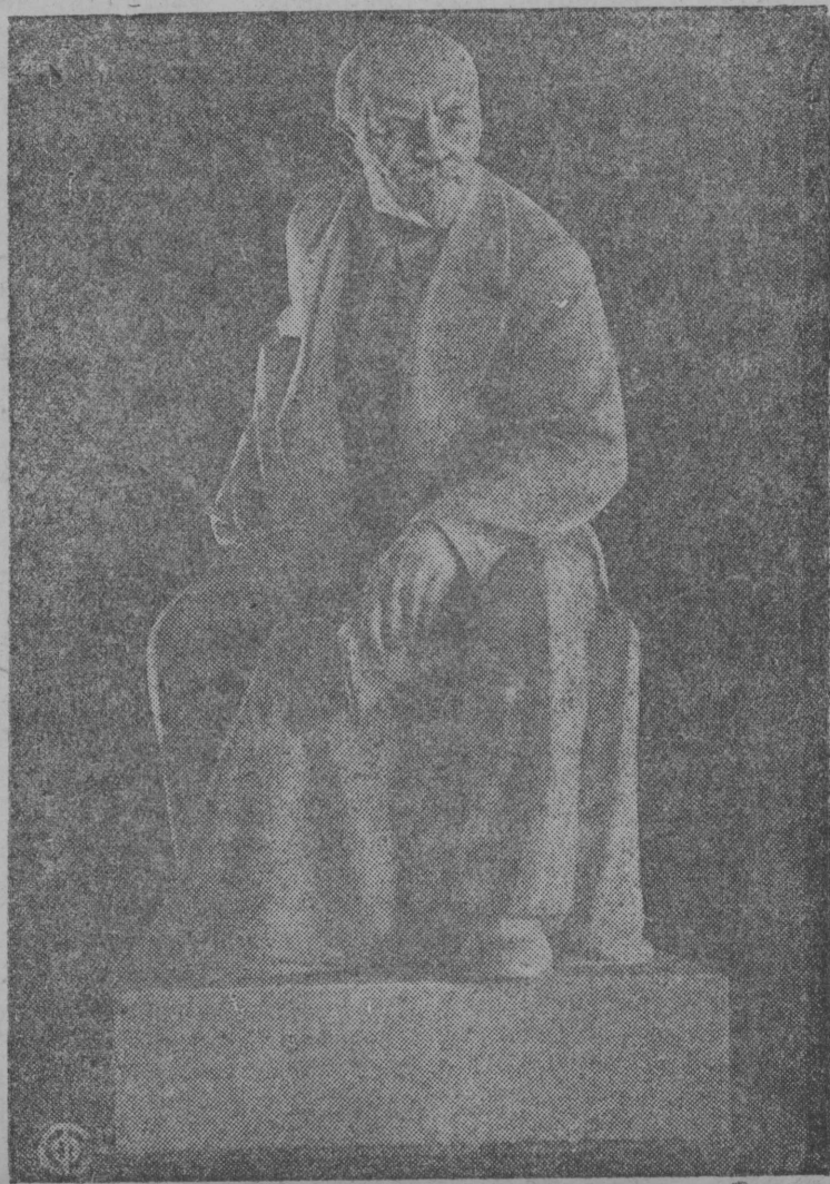
В. И. ЛЕНИН Скульптура С. Меркурова.

Дело Ленина продолжает его лучший ученик и гениальный соратник, великий Сталин, под мудрым руководством которого в СССР построено социализм. Грандиозные победы социализма отражены в сталинской Конституции, величайшем документе нашей эпохи. Под знаменем Ленина, под руководством Сталина пролетарская революция идет к победе во всем мире.