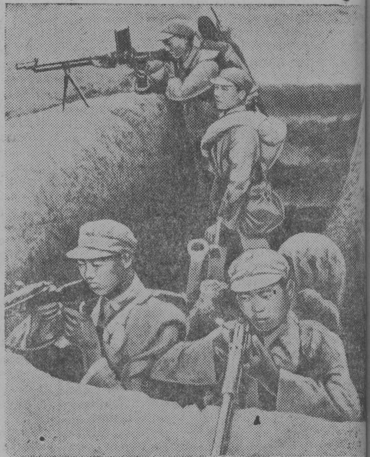
Китайские войска защищают захваченные у японцев позиции.

В провинцию Шаньдун японцы перебросили значительные силы маньчжурской армии. Армия "Маньчжов-Го" состоит из китайских крестьян, которые переселились в Маньчжурию из провинции Шаньдун. Эти войска не желают воевать против своих братьев. Переход маньчжурских частей на китайскую сторону привал массовый характер.