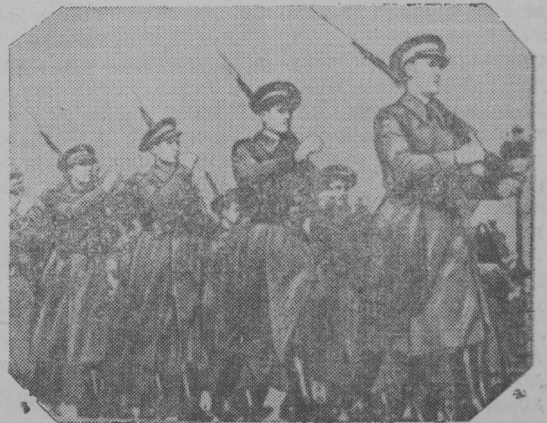
Части республиканской армии во время парада (Барселона).