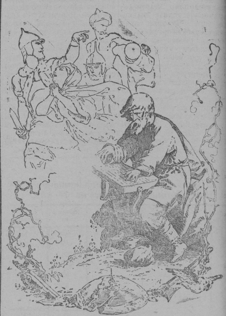
На снимке: Иллюстрация худ. Зичи (1853 г.) к „Слову о полку Игореве“, изданному в 1854 году, в переводе Н. Гербеля

К 750-летию „Слова о полку Игореве“ В мае Советский Союз отмечает 750-летие гениального произведения древне-русской эпической поэзии „Слова о полку Игореве“—дошедшего до наших дней письменного памятника древне-русского творчества 12 века, оказавшего огромное влияние на русскую литературу.