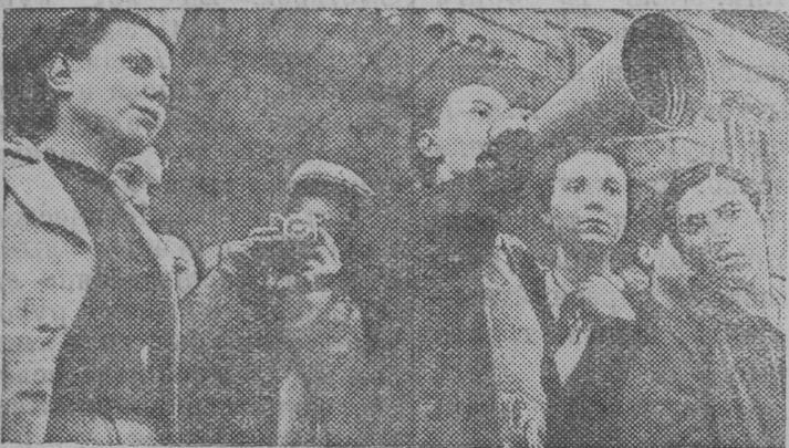
Снимок вылын: Барселонаын том отирлэн группа улицаезын агитируйтэ армияэ встушайтэм понда.

Республиканскэй Испаниялэн правительство чулэтэ добровольцевезэ 100 тысячнэй призыв.