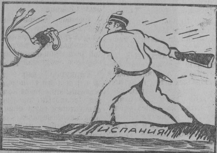
„Итальянскэй солдатэс медбэр'я „петкэтам“ (испанскэй народлэн вариант).