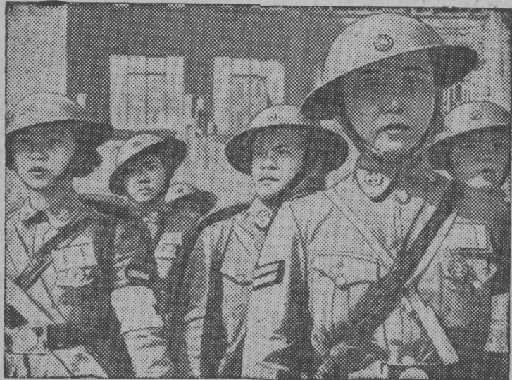
Снимок вылын: китайскэй женскэйез, кэдна пырсэ санитарнэй отрядэ, чулэтэны велэтчэм.

Китайскэй командованнэ заявленнэ сьэрти, Фунцзянь провинцияын керэмэс оборонительнэй сооруженнэез. Китайскэй войскаез готовэ сетны решительнэй сопротивленнэ японеццез попыткаезлэ пырны провинция пытшкэ.