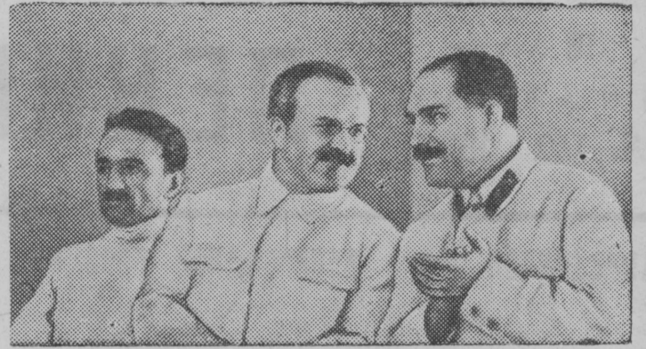
Снимок вылын: (шульталаньсянь веськытлань): Микоян А. И., Молотов В. М. да Каганович Л. М. Сессия первэйся заседаннэ вылын Совнарком лажакын.