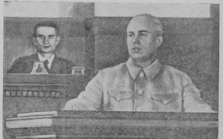
Снимок вылын: СССР Верховнэй Совет депутатлэн КП(б) УЦК секретарлэн Н. С. Хрущевлэн Сессия первэй заседаннэ вылын выступленнэ.