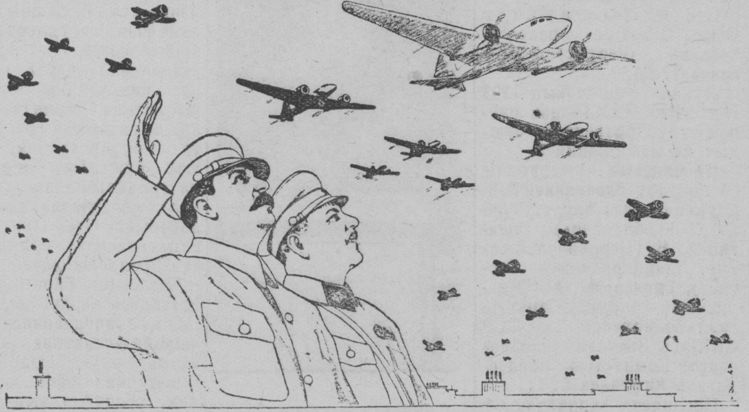
Денисов Н. художниклэн перерисовка Денисов Н. художник да Ватолина Н. плакат вылэсь.