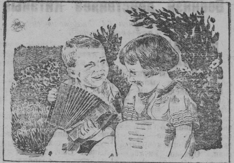
Г. Ленинградись Дзержинскэй районись Шалозо деревнянн.