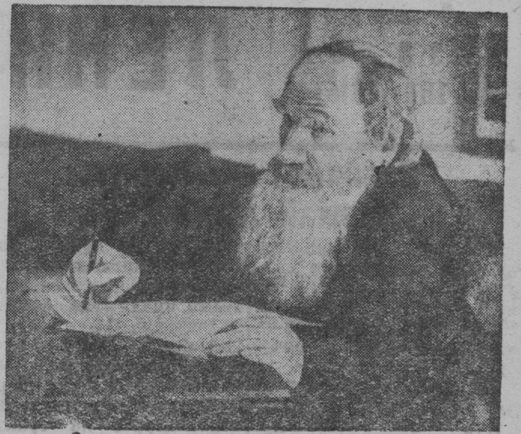
Снимок вылын: Лев Николаевич Толстой.