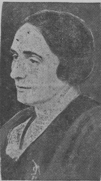
Снимок вылын: Долорес Ибарури (Пасионария)

Парижын вэлі массовэй митинг, када вэлі организуйтэм мир защиталэн Международней конференция кончитчэмлэ. Митинг вылын выступитис Долорес Ибарури, када вэлі панталэм бурней аплодисментт'эсэн.