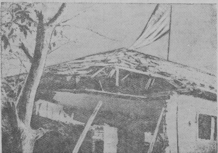
Сн. вылын: Учан городись Американскэй школа, кэдна разрушитэм японскэй интервентт'езлэн бомбардировкаэн.