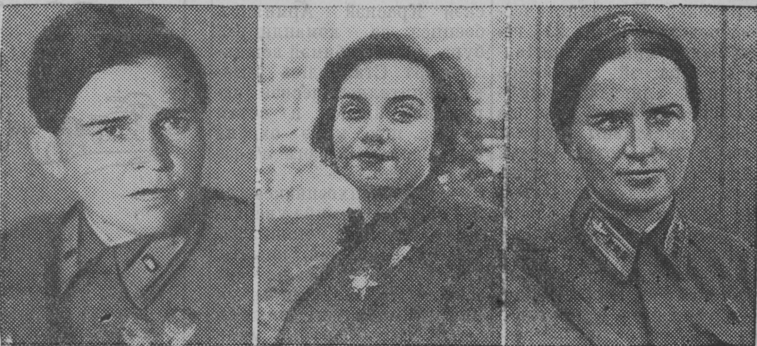
Снимок вылын (шуйлгаланьсянь вескытланьэ): „Родина“ самолетлән 2-эдэ пилот, капитан—орденоносец П. Д. Осипенко, экипажлән командир, СССР Верховнэй Советлән депутат, орденоносец В. С. Гризодубова, „Родина“ самолетлән штурман старшэй лейтенант—орденоносец М. М. Раскова.