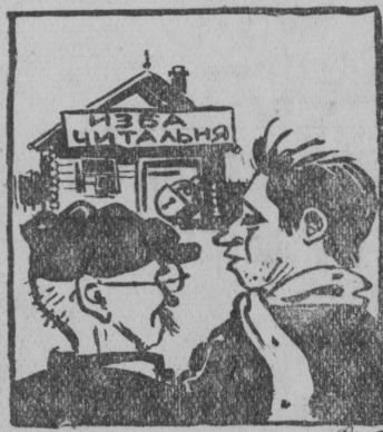
—А кытэн изба-читальняисе ключис? —А мыйлэ сийа колэ, ед сёрово читальняисе оз уджав. Рис. В. Анфиловлэн „Прессклише“

Мукэд сельсоветт'езын изба-читальняез либо совсем оз уджалэ либо уджалэны эддэн умэля