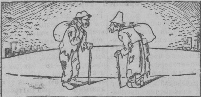
Польскэй крестьянин:—Ме муна обнищалэй деревнясь. Кылі городын буржык.

Польша нищеталэн страна, 1,6 миллиона морт быд год чапкэны деревня да мунэны горөдд'езэ кошшыны удж.