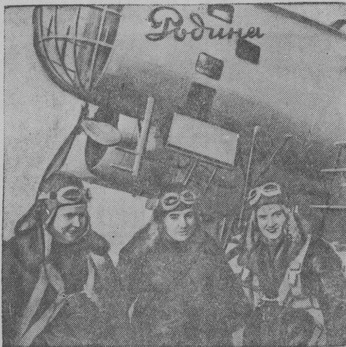
СНИМОК ВЫЛЫН: (шульгаланьсынь веськытланэ) „Родина“ самолетлэн III-эт пилот капитан-орденоносец П. Д. Осипенко, экипажлэн командир, СССР Верховнэй Советлэн депутат, орденоносец В. С. Гризодубова да самолетлэн штурман, старшэй лейтенант-орденоносец М. М. Раскова „Родина“ самолет дынын.

Сентябрь 24 лунэ 1938 годэ 8 час 12 минутэ асывнаэс московскэй кад сьэрти страна пасьта известнэй летчицаез-орденоносецез Валентина Степановна Гризодубова, капитан Полина Денисовна Осипенко да старшэй лейтенант (штурман) Марина Михайловна Раскова л'ебзисэ беспосадочнэй перелэтэ Москвасынь Дальнэй Востока кыкмоторнэй „Родина“ самолет вылын. Героическэй летчицаэз блестящэй керисэ асинис перелет.