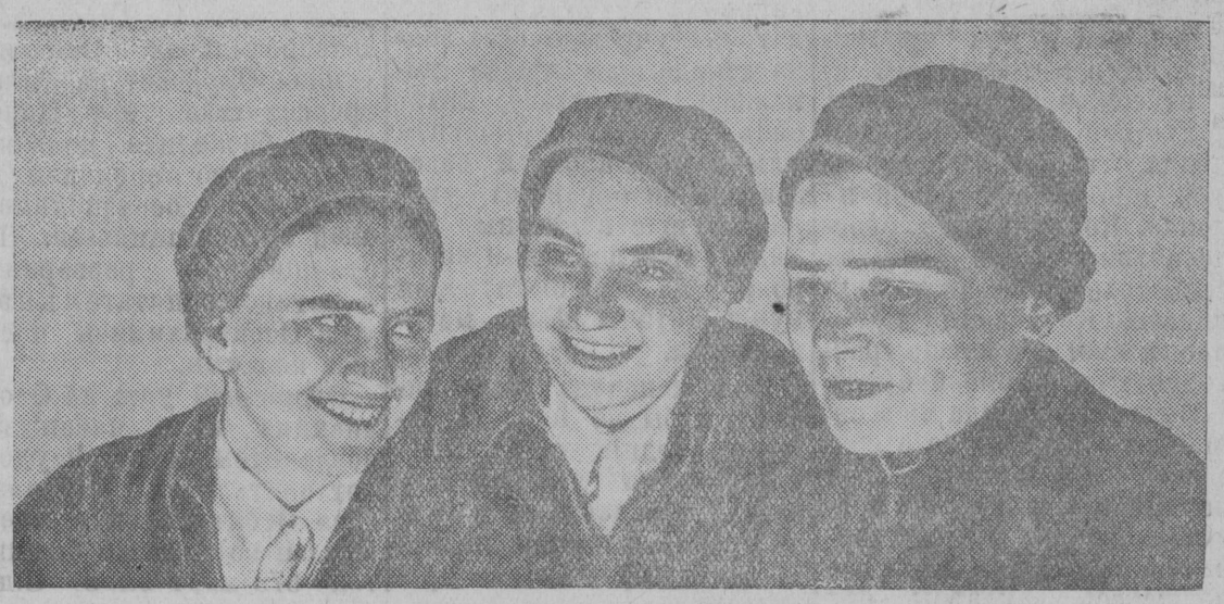
СНИМОК ВYЛЫН: „Родина“ самолетлэн героическэй экипаж (шуйлгаланьсянь веськытлань): М. М. Раскова, В. С. Гризодубова, П. Д. Осипенко.