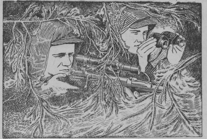
Снимок вылын: Одесскэй областнэй Осоавиахим советлэн снайперрез школась велэтчиссез. Рисунок фотось Погорелколэн.

Одессаньс уджалысь молодежь изучайтэ стрелковэй дело.