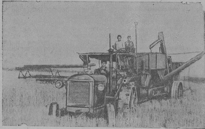
Снимок вылын: „Цинамхрис“ колхозын (Сигнахскбй область, Грузинскбй ССР) ид дзимлялбм коста.

Грузинскбй ССР-ын колосбвбйез дзимлялбм.