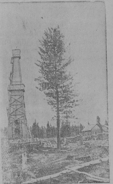
Снимок вылын: Невской поселокын (Барзасской район, Новосибирской область) нефтеразведкалӧн общӧй вид.

Сибирын топливной база создӧйтӧм понда разведывательной уджез.