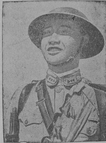
Снимок вылын: Китайской армиялн младшой командир.