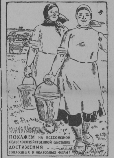
Плакат работы художника Еремина.