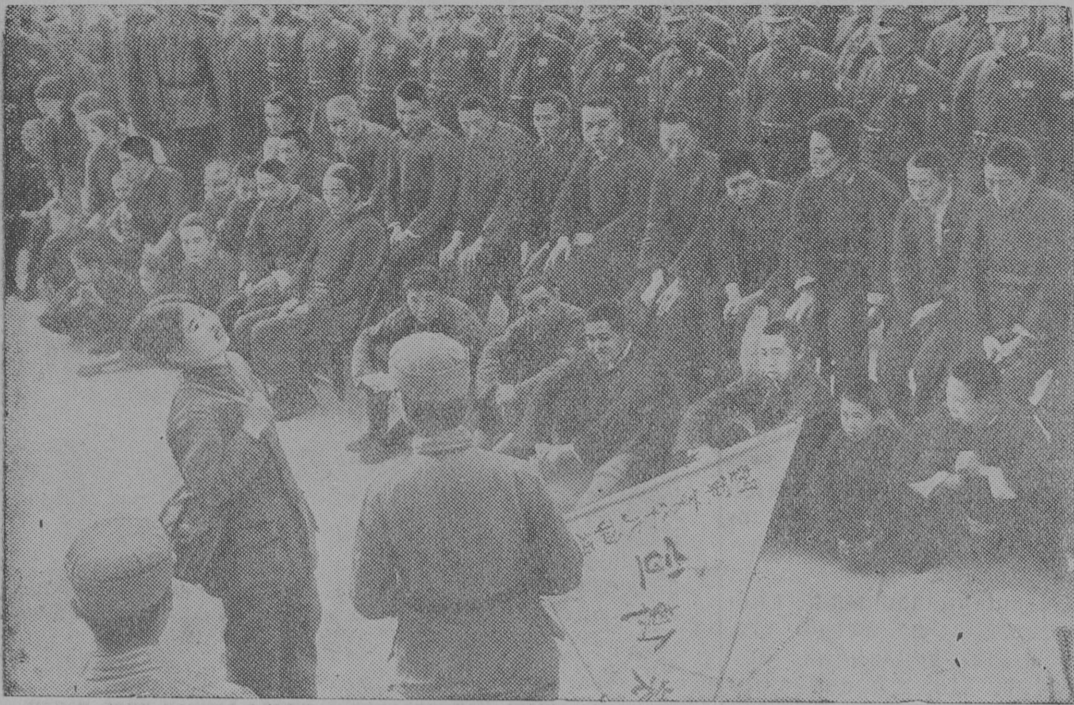
На снимке: Агитотряд одной из частей китайской армии даёт представление в прифронтовой деревне.